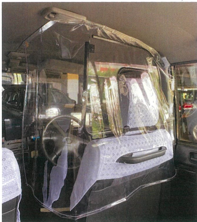
上部はアルミ板(中型用/小型用)で固定。料金用の切欠きは無し。