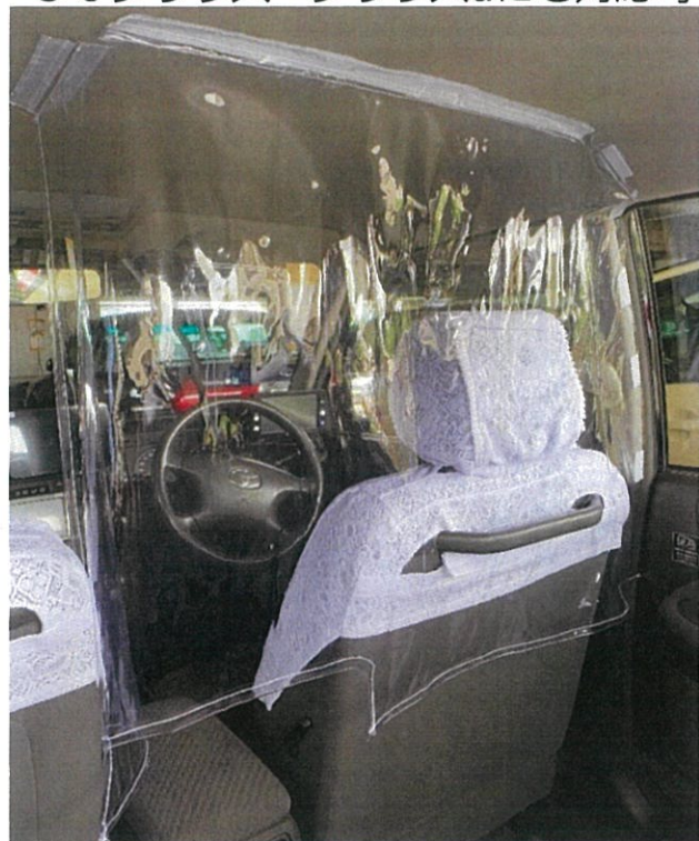
上部はマジックテープで固定。料金用の切欠きあり